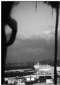
Bis 15. November, Di-Sa 12-18 Uhr, Potsdamer Str. 105