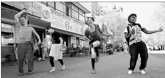
Gob Squad bei einer heiklen Mission: Welt retten

Das Schöne an der Welt ist doch, dass sich immer mal welche aufmachen, sie zu retten. Zu so einer Bruce-Willis-Mission hat sich nun auch das Künstlerkollektiv Gob Squad durchgerungen. „Saving the World“ verspricht es in seiner neuesten Produktion, und es geht dabei um die üblichen grundlegenden Dinge wie Liebe, Geld, Freiheit oder Tod, die von echtem Fachpersonal erläutert werden: nämlich ganz normalen Weltbürgern, die von Gob Squad am Mehringplatz eingefangen und filmisch festgehalten wurden. In einer Rundum-Projektion wird diese auf Videoframe eingedampfte Welt ab Donnerstag im HAU 2 präsentiert.