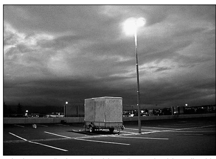
Mehr als 50 von KünstlerInnen betriebene Räume und Projekte stellen sich am Wochenende in der Akademie der Künste vor. Vom Wedding über Malzmö bei Reykiyok reicht das Netz, das die Internationale Gesellschaft der Bildenden Künste für „Art Swap Europe“ gesponnen hat. Neben einer Ausstellung gibt es Raum für Workshops und Gespräche. Samstag, 10 bis 20 Uhr, So 10.30 bis 14 Uhr, Hanseatenweg 10

Aedes Pfeiffering (# 2827015) Meeschen in Deutschland. Fotografien. Di-Fr 11-19, Sa+So 13-17 bis 16.10. Christenst. 18/19 Akademie der Künste (# 200572000) Notation, Kalkül und Form in den Künsten. Di-So 10-18 bis 16.11. Hanseatenweg 10 Arneunald E. V. (# 28046650) Transcultural Paranoia. Gruppenausstellung. Di-Fr 11-19, Sa 10-18 bis 31.10. Schumannstr. 68 artTransponder e. V. (# 30642400) Peace – Utopia or Real Space?. Weiterer Ausstellungsort: Projektraum Catalyst, Schumannstr. 34. Do 12-17, Fr+Sa 14-19 bis 2.11. Brunnenstr. 151 Berlinische Galerie (# 78902600) Berlin im Umbruch – Aus der Sammlung Kunst in Berlin. Neuorganisation der Sammlung. Mi-Wo 10-18 bis 31.12. Alte Jakobstr. 124-128 daadlerle (# 2613640) Shinobuku: Sea, Sky, Language and So On. Mi-Sa 10-18 bis 11.10. Zimmerstr. 90/91 Dune Berlin (# 7592302) Grit Hachmeister: Vom Himmel gelandet. Di-Sa 11-18 bis 18.10. Invalidenstr. 90 Edition Block (# 32304069) Ich keime kein Weckend – Beuys & Block: die gemeinsamen Editionen 1966-1986. Di-Sa 11-18 bis 6.11. Heidestr. 50 Galerie Davide Gallo (# 30607269) The Distance to the Sun. Videos. Di-Sa 14-19 bis Oktober-Linien: 156 Galerie Gillian Martin (# 20279214) Magdalena von Rudy: Untold Stories. Di-Sa 13-18 bis 6.11. Brunnenstr. 3