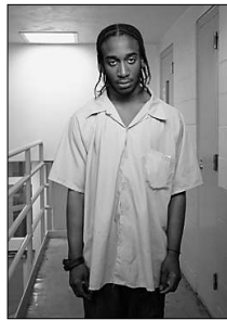
Bis 16. November, Di-Sa 10-19, Do 12-21 Uhr, Linienstr. 69

„Für die Mehrheit der Gesellschaft ist das Gefängnis ein ... Ort, mit dem sie ... nicht in Berührung kommt“, heißt es zur Ausstellung, für die Susanne Pfeffer 15 KünstlerInnen geladen hat. Ob das der Grund ist, dass die Schau wenig berührt? Die Inhaftierten und Wärter amerikanischer Gefängnisse, die Fiona Tan projiziert, scheinen jedenfalls aus unzähligen Filmen bekannt. Gregor Schneiders Isolationszelle erinnert eher an einen eleganten Science-Fiction denn an die unterfinanzierte Realität. Sicher gibt es spannende Perspektiven (Wedemeyer, Plöger, Bresson, Negri). Der Gesamteindruck ist leider aber eher mau. MJ